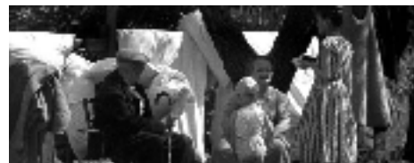
Bitwa Targówka z Pelcowizną [WARSZAWA NIEODBUDOWANA]

Małgorzata Chechlińska z Inicjatywy Osiedle Przyjaźń odniosła się z kolei do budowanego przez dewelopera przy ul. Olbrachta osiedla Przyjaciół - kilkupiętrowych bloków wciśniętych między parterową zabudowę osiedla Przyjaźń z jednej strony i osiedle domków jednorodzinnych na Jelonkach z drugiej. - To kompletnie zaburza ład przestrzenny okolicy. Czy nowy plan może zatrzymać takie procedury? - pytała. - Plan może być na nie obojętny - przyznała Potapowicz-Trębacz.