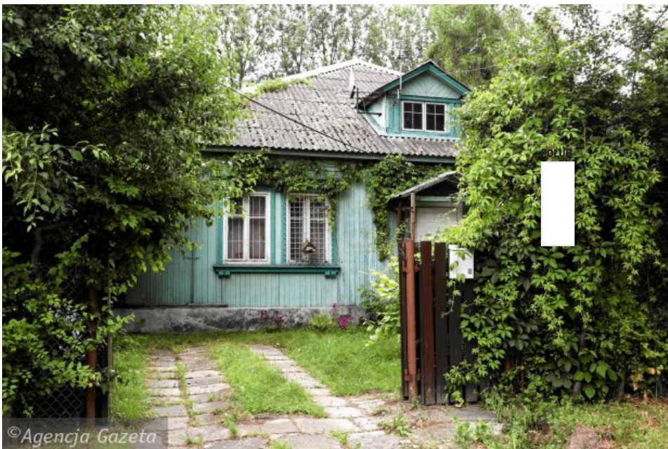
Kolorowe domki na osiedlu Przyjaźń powstały dla budowniczych Pałacu Kultury i Nauki (Albert Zawada)