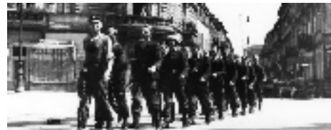
Co wiesz o powstaniu warszawskim? [QUIZ]